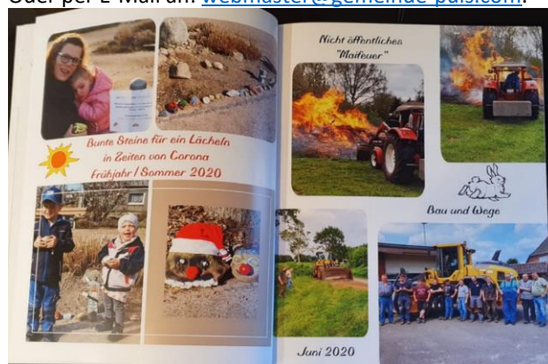
Exemplarisch eine Doppelseite von 30 Einzelseiten

Oder per E-Mail an: webmaster@gemeinde-puls.com .