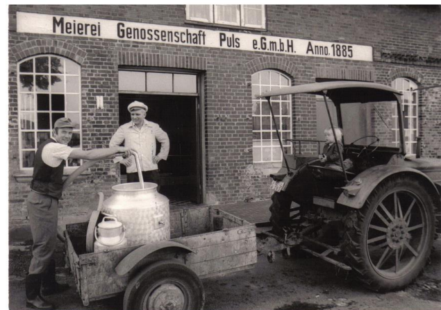
letzte Milchannahme 01. September 1972